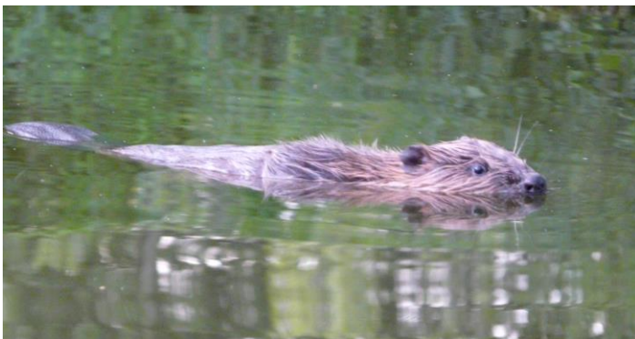
Le castor est un animal protégé.

L'autre risque d'inondation, bien plus important, vient de la Loire, qui peut refluer par la confluence avec le Loiret, ou pire encore par submersion du Val.